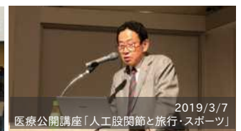
2019/3/7 医療公開講座「人工股関節と旅行・スポーツ」