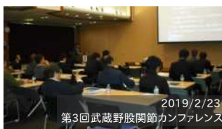
2019/2/23 第3回武蔵野股関節カンファレンス