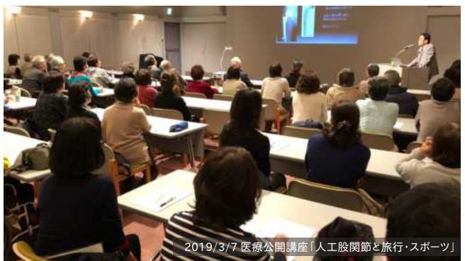
2019/3/7 医療公開講座「人工股関節と旅行・スポーツ」

医療公開講座「人工股関節と旅行・スポーツ」(会場:ルネこだいら) ※4月4日(木)小金井市、4月25日(木)狹山市、5月16日(木)西東京市でそれぞれ開催します。