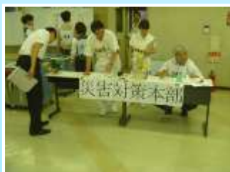
会計前に対策本部を設置