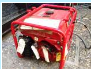
ポータブル発電機