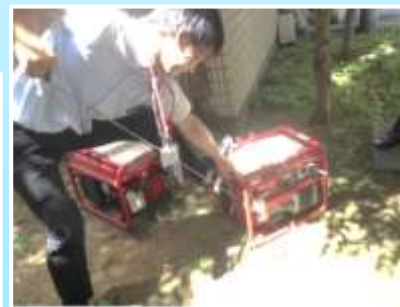
短時間での起動が可能